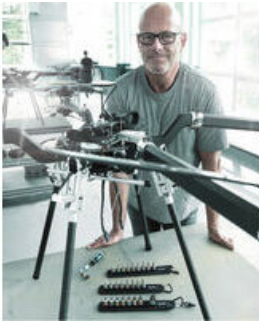
Die Wera Belts